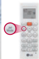
So funktioniert's: ein Klick „Jet Mode“